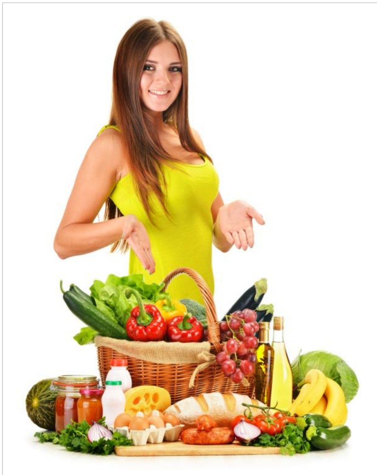
Rysunek 1.2 Jakość towaru